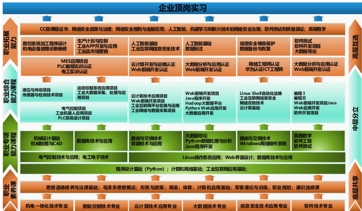
图 3 项目引领、任务驱动“231”课程体系

为适应《中国制造 2025》战略规划和国家“新基建”对具有国际视野高素质技术型人才的大量需求，贯彻落实职业教育“以服务为宗旨，以就业为导向，以能力为本位，为生产一线培养高素质应用型人才”培养目标，学院对大数据技术专业进行全新改造，与机电一体化技术专业、智能控制技术专业、云计算技术应用专业、软件技术专业、信息安全技术应用专业组成工业互联网专业群，采用产教融合、校企合作的方式共建，全面实施“231”人才培养模式如图 3 所示，在课程内容设置方面嵌入了大量工业互联网知识，深化新工科的建设；在教学方式方面采用“项目引领、任务驱动”的“231”课程体系；在项目内容方面引进模块化企业生产场景。其突出特色在于，以对接企业实际生产岗位所需技能点的项目作为人才培养的依托，适当压缩理论性较强的专业基础课程，将传统专业基础课程和专业核心课程内容按照实际需求嵌入到项目课程的各个具体实践环节，做到知识碎片化、能力系统化。贯彻理论与实践相结合、学以致用、即学即用的“现代学徒制”培养路线，真正实现专业设置与产业需求对接、课程内容与职业标准对接、教学过程与生产过程对接。