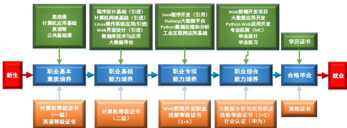
图 2 课程体系与职业能力之间的匹配关系

课程体系的设置服务于专业能力结构的要求，整个课程体系划分为公共课、专业基础课、专业核心课、专业拓展课、毕业实践等五大模块，为学生逐步构建职业基本素质、职业基础能力、职业专项能力和职业综合能力，以适应职业面向与岗位需求。